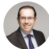
FINANCES ET ADMINISTRATION