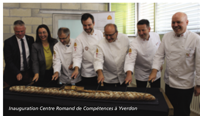
Inauguration Centre Romand de Compétences à Yverdon