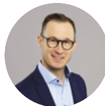
ASSOCIATIONS, MANIFESTATIONS PROMOTIONS ET PRESTATIONS